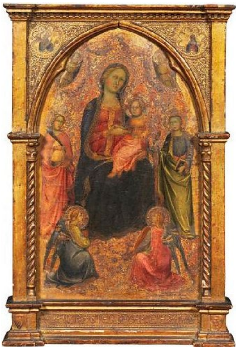
Cennino Cennini. Madonna met kind . Tempera op paneel, 62 cm x 42 cm.