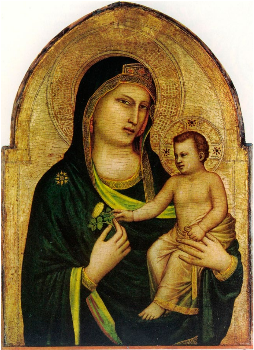
Giotto. Madonna met Kind . 1320-1330