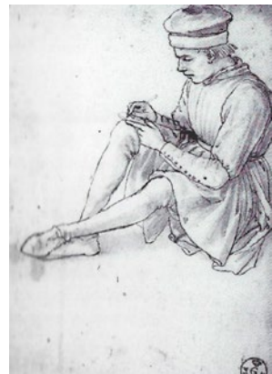
Maso Finiguera. Zittende schildersgezel tekenend op paneel. Pen, wassingen, wit opgehoogd op rozerood papier.