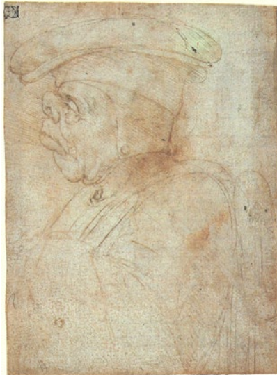
Leonardo da Vinci. Zilverstift op papier.

En laat de helmstok en de stuurman van dit vermogen om te zien het licht van de zon zijn, het licht van je ogen en je eigen hand: want zonder deze drie dingen kan niets systematisch gedaan worden.