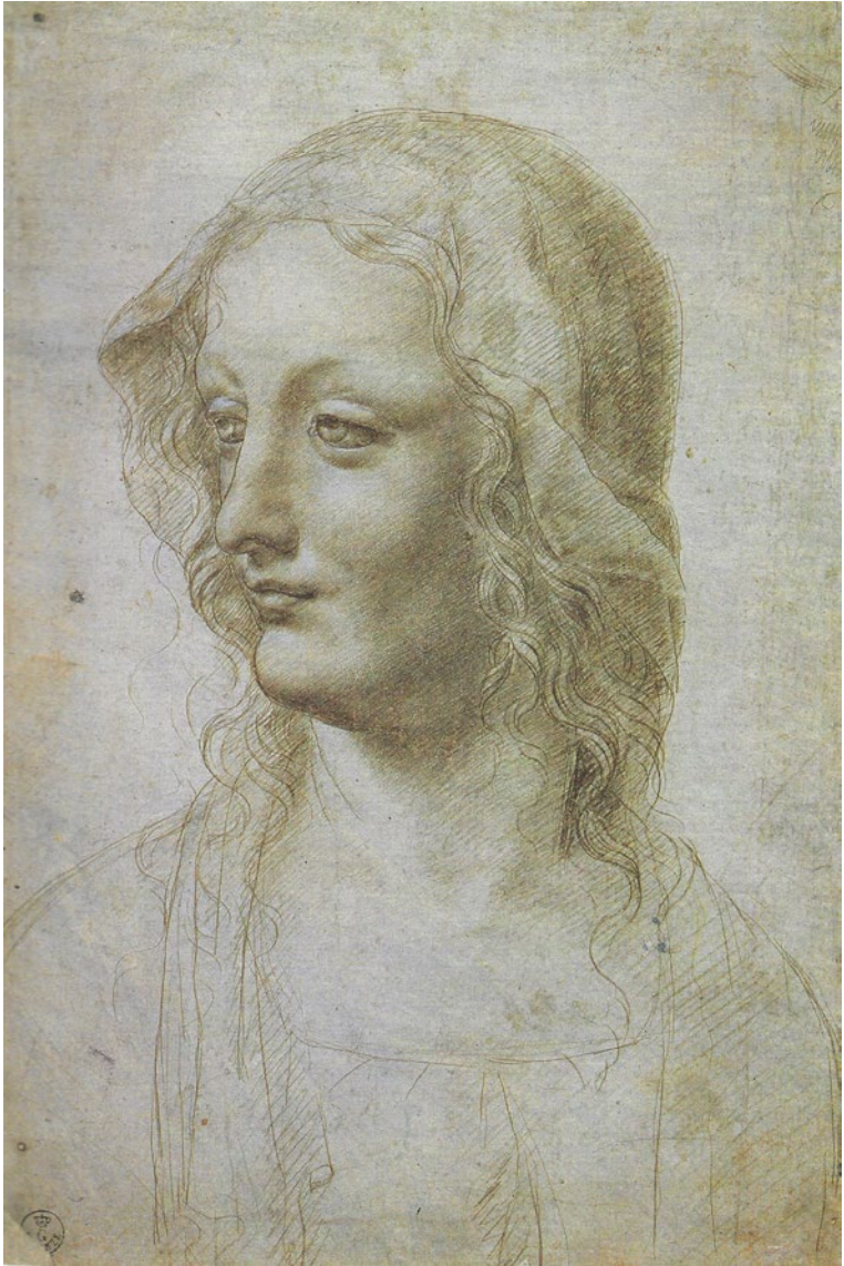
Leonardo da Vinci. Karakterkop . Silberstift.